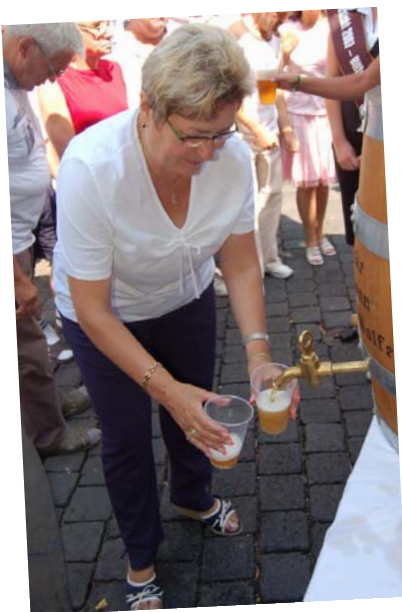
Mit Spannung wieder erwartet: Der traditionelle Freibieranstich.