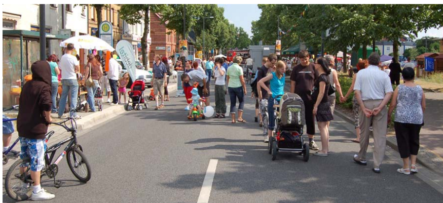
Am Festwochenende war die Leipziger Straße voller Menschen.

Ein großes Ereignis konnten die Bitterfeld-Wolfener vom 06.-08.06.08 beim Vereins- und Familienfest erleben. Von Freitag bis Sonntagabend war der Ortsteil Wolfen von Musik und Tanz geprägt. Und ganz nach alter Tradition gab es am Sonntag auch wieder den Freibieranstich durch die Oberbürgermeisterin. Am Freitag erbegann das Fest mit abwechslungsreichem Musikprogramm. Natürlich live und da wurde gleich zu Beginn mit Frauenpower durchgestartet. Vertreten war diese durch die Band „Scarlett“. Danach erfreute die „Halle luja“ Westernhagen Coverband die Gäste, bevor es um punkt Mitternacht ein kleines abschließendes Feuerwerk gab. Der Samstag stand im Zeichen des Sports. Es gab Vorführungen von Sportvereinen. Auch wurde das 2. Wolfener Seifenkistenrennen durchgeführt. Aber auch für Musik war durch die Darbietung künstlerischer Vereine zahlreich gesorgt. Abschließend sammelten sich die Menschen am Studio D4, dem