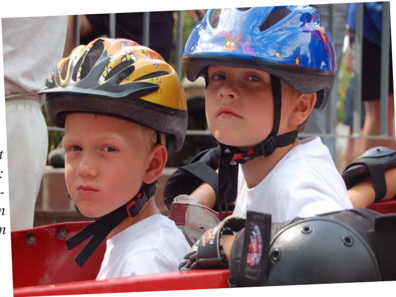
Vollkonzentriert auf den Start: Junge Seifenkistenpiloten kurz vor dem Rennen. (Ergebnisse umseitig)