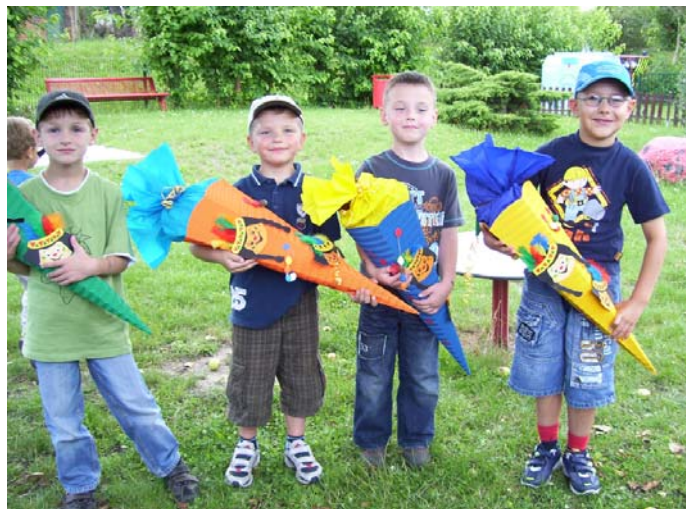
Das sind die künftigen Erstklässler.

Dort gab es viel zu erleben, so sahen wir den Elefanten beim Baden zu, beobachteten Giraffen, Löwen und andere Tiere, ganz besonders schön war das Toben auf den vielen schönen Spielplätzen. Zur Abschlussfeier waren dann alle Kinder der großen Gruppe mit ihren Eltern eingeladen. Bei verschiedenen Spielen durfte dann jeder seine Geschicklichkeit und sein Wissen beweisen. Die großen Zuckertüten, die in der Zwischenzeit am Baum hingen, wurden dann mit Liedern „ersungen“. Ein ganz besonderer Höhepunkt war die Hüpfburg der Freiwilligen Feuerwehr von Bobbau. Für das leibliche Wohl war mit Kuchen, Würstchen, frischen Waffeln und Getränken gesorgt. Das Team der Kindertagesstätte „Pumuckl“ Bobbau möchte sich ganz herzlich bei den Eltern der Einschüler für die jahrelange vertrauensvolle