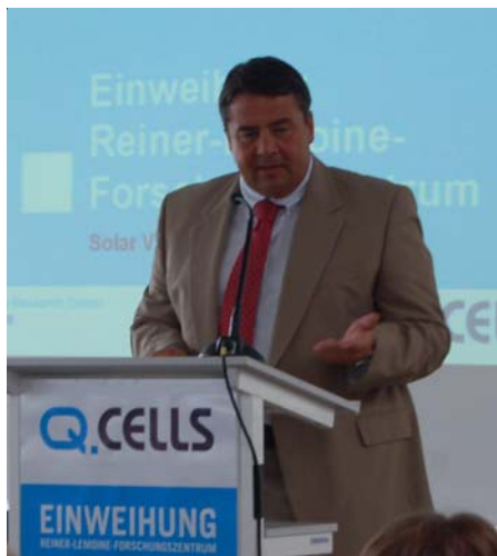
Bundesumweltminister Gabriel war gekommen, um bei der Eröffnung dabei zu sein.