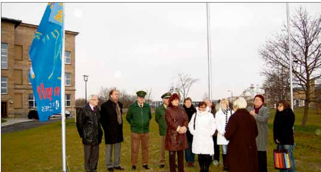
Gemeinsam wurde den zahlreichen weiblichen Opfern von Gewalt an Frauen am 25. November gedacht.

Gemeinsam mit Vertretern des Frauenhauses, des Frauenzentrums Wolfen, des Polizeirevierkommissariats, des Weißen Ringes e. V. und Landtagsabgeordneten wurde vor dem Rathaus der Stadt eine Fahne gegen diese Form von Gewalt gehisst.