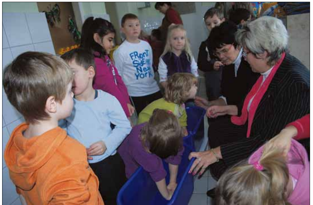
Spezielle Schüsseln können variabel und unabhängig vom Kneipp-Bad eingesetzt werden. Eine Spende aus Witten hat dies ermöglicht.