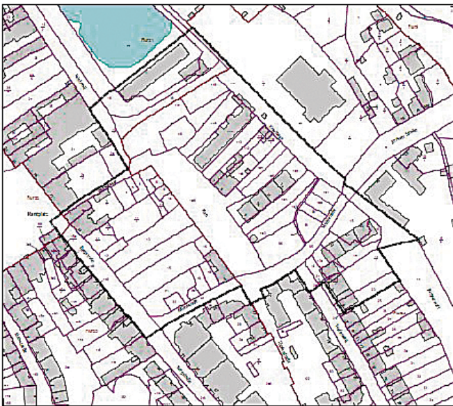
Geltungsbereich des B-Planes 03-2010btf

Der Bebauungsplan kann einschließlich seiner Begründung während der allgemeinen Öffnungszeiten in der Stadtverwaltung Bitterfeld-Wolfen, Verwaltungssitz im Ortsteil Wolfen, Rathausplatz 1, Zimmer 201, 06766 Bitterfeld-Wolfen eingesehen und über seinen Inhalt Auskunft verlangt werden.