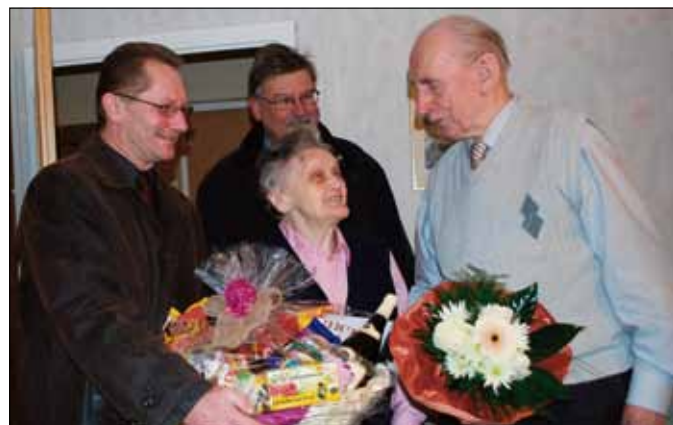
Herzliche Gratulationen und ein strahlendes Ehepaar, das heute ebenso glücklich ist wie vor 65 Jahren.

gestellte zurückblicken. Heute genießen sie die Früchte ihres arbeitsreichen Lebens. Vor allem die Fürsorge ihrer Kinder ist ihr Lebensglück, das sie zu schätzen wissen. Pressestelle