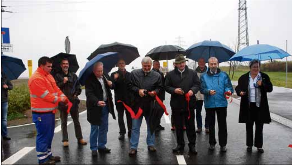
Freigabe des dritten Bauabschnittes der Thalheimer Straße vom Lützowweg bis zum Ortseingang Thalheim

Insgesamt wurde die Kreisstraße auf einer Länge von drei Kilometern mit einem finanziellen Aufwand von 3,52 Millionen Euro erneuert. In diesen Kosten enthalten ist auch die grundhafte Erneuerung der städtischen Straße von der Kreuzung Damaschkestraße bis hin zum Kronendorfer Kreisel.