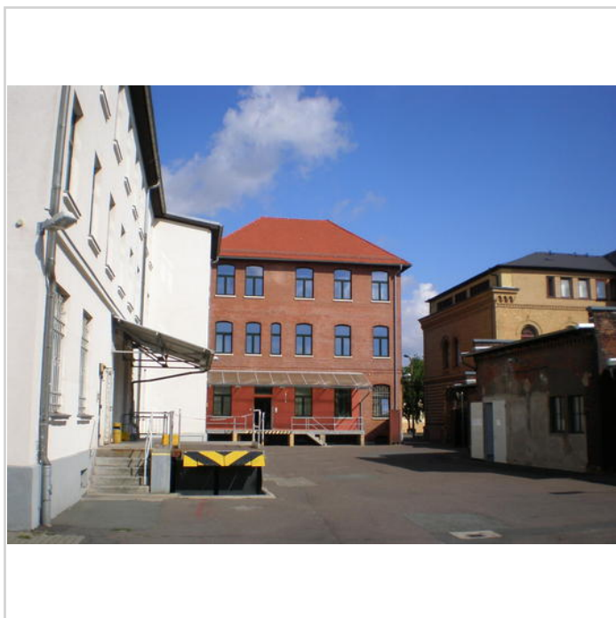
Ansicht vom Hof

Vermietbare Fläche: 3.245,00 m 2 Kaufpreis: 670.000,00 EUR