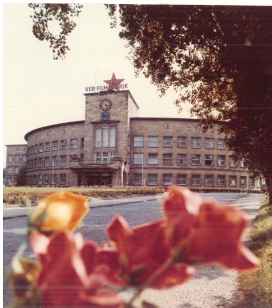
Auf dem Turm erstrahlte in den Anfangsjahren der DDR der rote Stern, der die Planerfüllung anzeigte