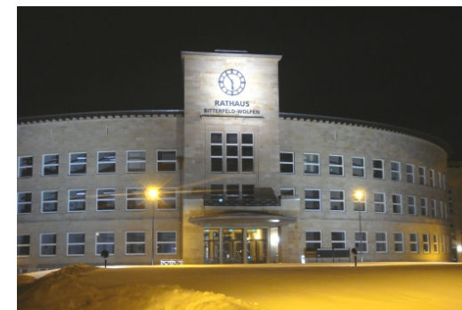
Das ehemalige Gebäude 041 erstrahlt im neuen Licht als Rathaus der Stadt Bitterfeld-Wolfen