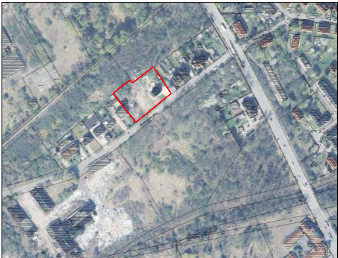
Aktenzeichen: 2017 / A18-205-2010-7

Die genauen Grenzen des räumlichen Geltungsbereiches sind der Plandarstellung des Bebauungsplans zu entnehmen.