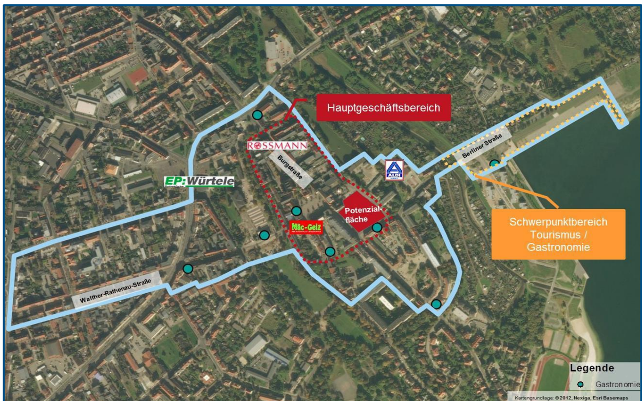
Abb. 02 Abgrenzung des zentralen Versorgungsbereichs Innenstadt Bitterfeld

Die Innenstadt von Bitterfeld ist das einzige urban gewachsene und zugleich kompakte Zentrum der Stadt Bitterfeld-Wolfen. Traditionell ist das Geschäftszentrum an den Markt und die unmittelbar abgehenden Straßen gebunden. Darüber hinaus hat die Verbindungsstraße zum Bahnhof (Walther-Rathenau-Straße) mit einer Reihe kleinteiliger Fachgeschäfte die Funktion einer Geschäftsstraße.