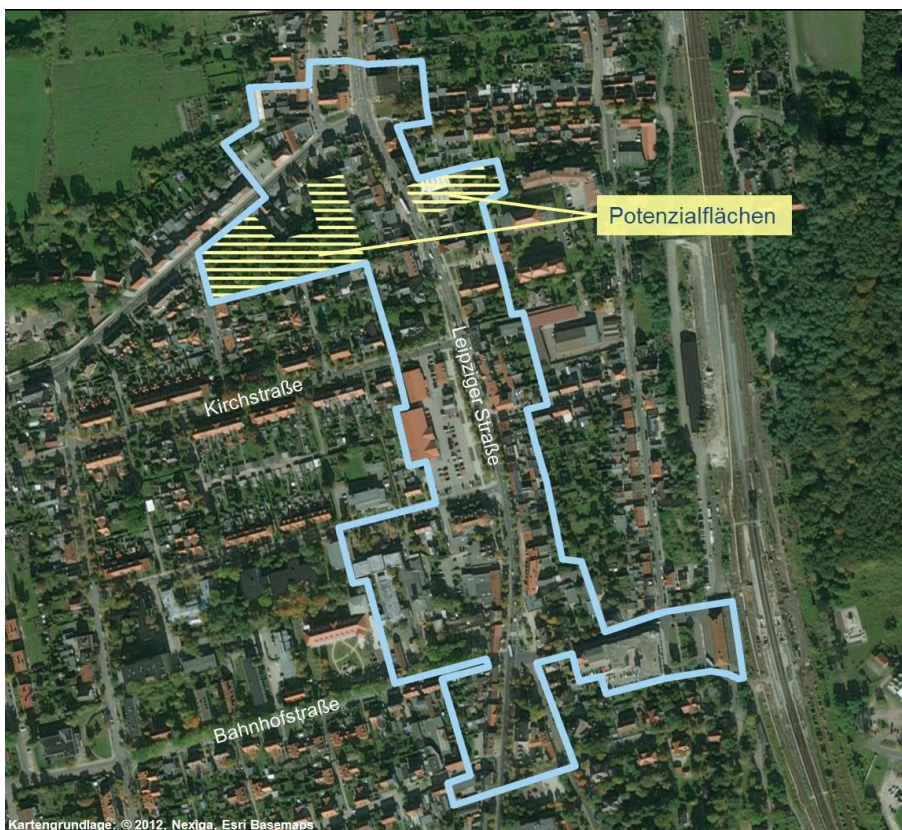
Abb. 03 Abgrenzung B- Zentrum Wolfen Leipziger Straße

Bei dem innerhalb der Altstadt gelegenen Ortsteilzentrum Wolfen - Leipziger Straße handelt es sich um ein langgezogenes straßenbegleitendes Zentrum entlang der Hauptverkehrsachse (B 184) einschließlich der Anbindung an den Bahnhof (Bahnhofstraße). Die Nord-Süd-Ausdehnung beträgt annähernd 700 m, und reicht von der Kreuzung mit der Straße der DSF im Süden bis zur Thalheimer Straße im Norden. Umfasst ist der Bereich mit einem zusammenhängenden Einzelhandelsbesatz, wobei mehrere Standortschwerpunkte zu verzeichnen sind. Die Verkaufsfläche beträgt gemäß EHZK insgesamt ca. 2.450 m 2 (2009 noch ca. 3.550 m 2 ).