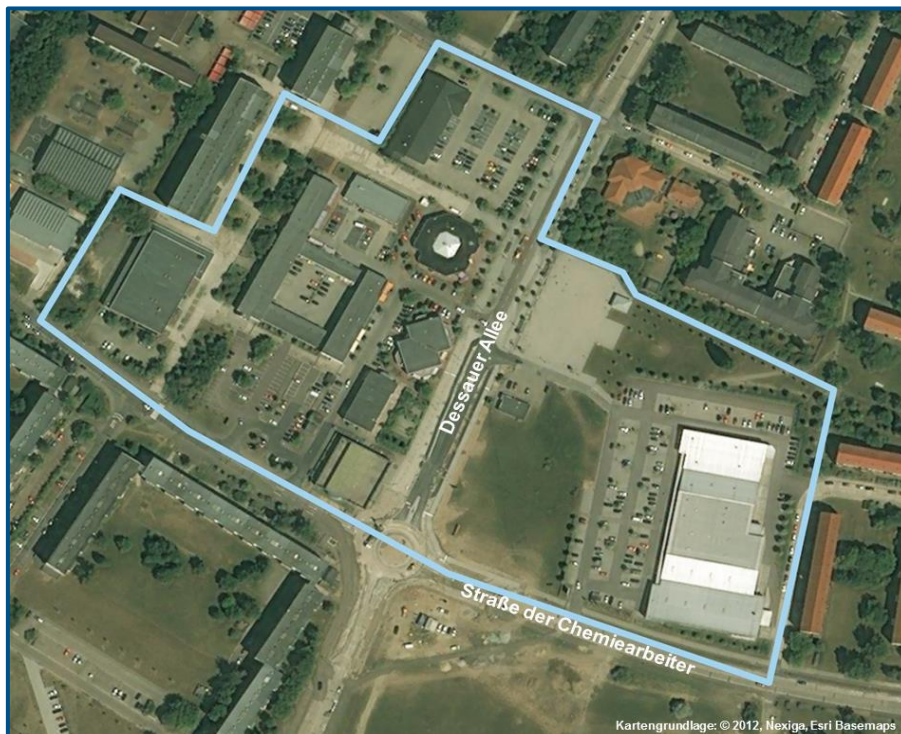
Abb. 04 Abgrenzung B-Zentrum Wolfen Nord

Das Zentrum der Plattenbausiedlung Wolfen-Nord liegt zentral unmittelbar am Kreuzungsbereich der beiden wichtigsten Verkehrsachsen Dessauer Allee und Straße der Chemiarbeiter. Ausgangspunkt bildeten bereits mit dem Bau der Siedlung zu DDR-Zeiten errichtete Funktionseinheiten. Nach 1990 entstand das Zentrum schrittweise aus mehreren Handels- und Dienstleistungskomplexen. Westlich der Dessauer Allee bilden vielfältige Dienstleistungsangebote und ein Gesundheitszentrum, ergänzt durch mehrere, kleine Fachgeschäfte, den Schwerpunkt. Am westlichen Rand befindet sich ein Möbelmarkt, am nördlichen ein Lebensmitteldiscounter. Östlich der Dessauer Allee besteht eine Einzelhandelsagglomeration mit Supermarkt, Lebensmittel-Discounter, Drogerie- und Textilmarkt.