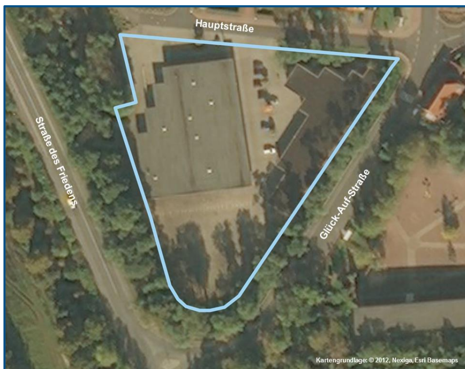
Abb. 05 Abgrenzung C-Zentrum Holzweißig

Das Angebotsspektrum umfasst die Grundversorgung, schwerpunktmäßig im kurzfristigen aber auch im ergänzenden mittelfristigen Bereich. Es ist geeignet für die Nachfrage des täglichen Bedarfs und des Wochenbedarfs