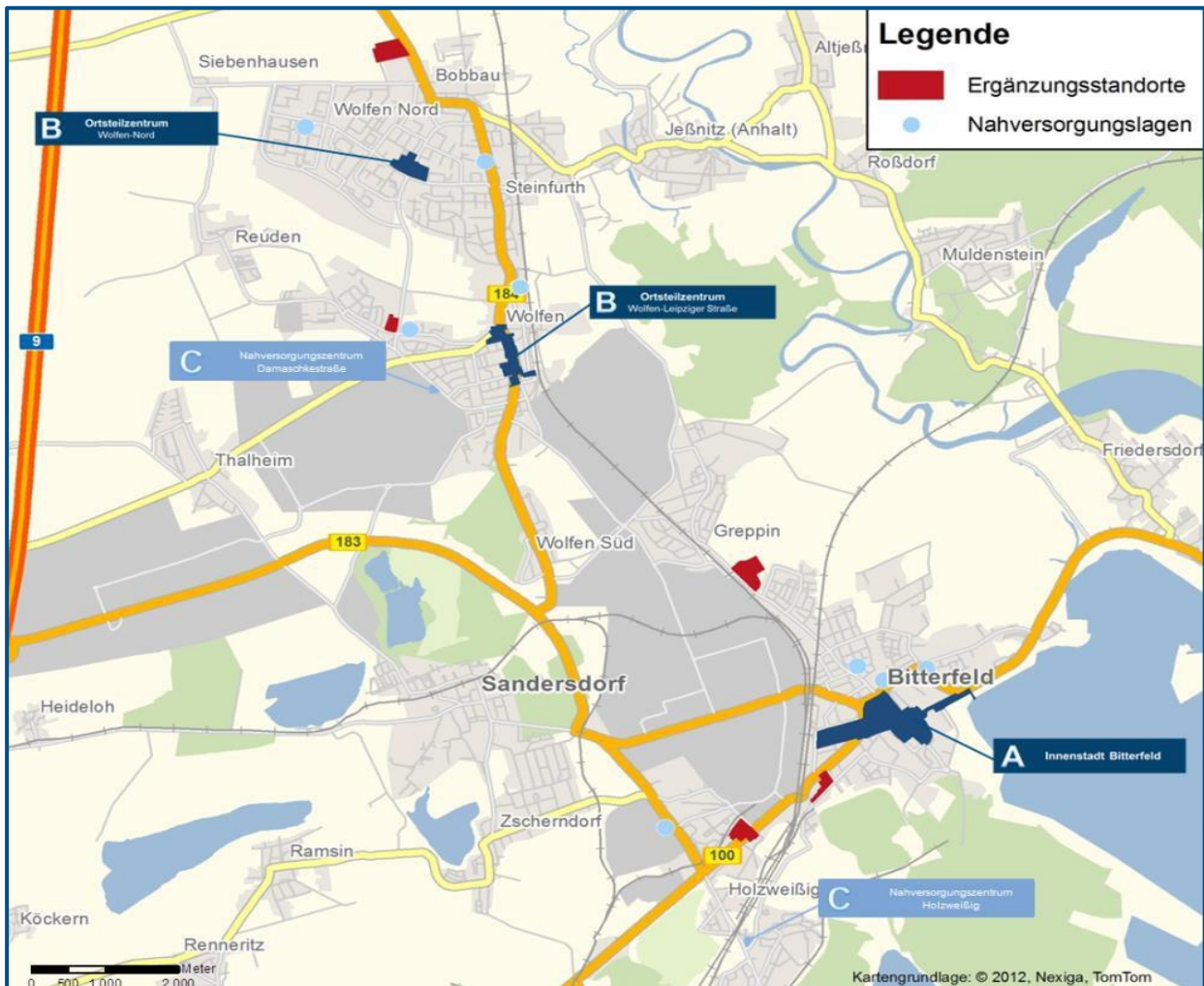
Abb. 01 Räumliche Struktur des Zentren- und Standortkonzeptes der Stadt Bitterfeld-Wolfen