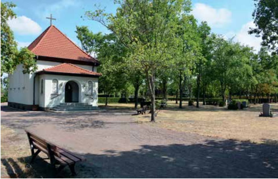
Friedhof OT Greppin Neue Staße 36 a 06803 Bitterfeld-Wolfen

Ansprechpartner: Friedhofsverwaltung OT Stadt Wolfen