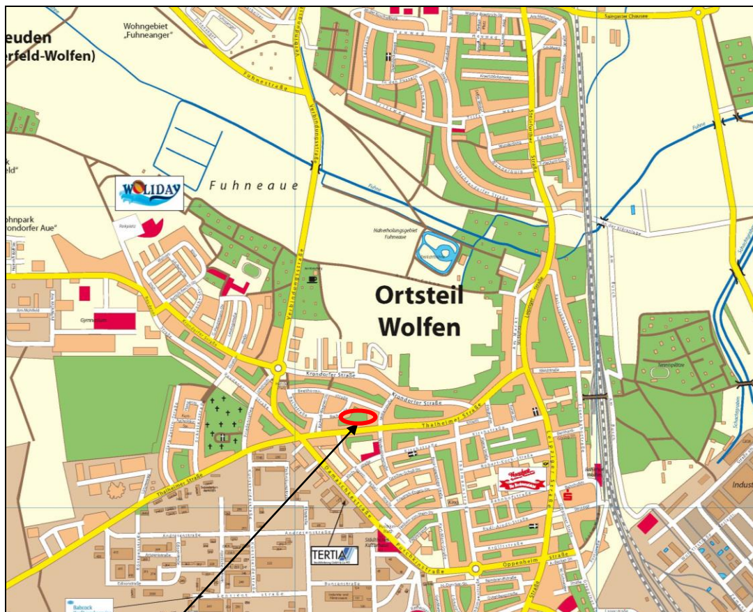
Auszug Stadtplan der Stadt Bitterfeld-Wolfen

Die verkehrliche Erschließung ist durch die Anbindung an die o.g. Straßen gesichert.