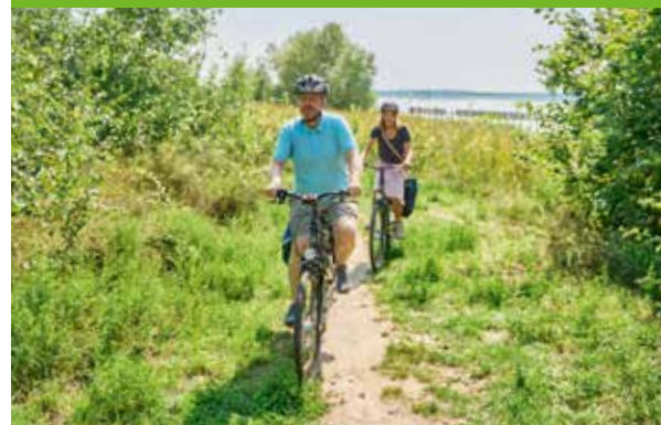
Radfahrer an der Goitzsche

Weiter entfernte Ziele lassen sich mit dem Rad erkunden, so auch der 36 km lange Rundweg um den Goitzsche-See. Er ist Teil des sehr gut ausgebauten Rad- und Wanderwegnetzes, das die Goitzsche Seeregion durchzieht. Viele der Wege bieten auch Freunden des Nordic Walkings sowie Skatern und Joggern ideale Bedingungen.