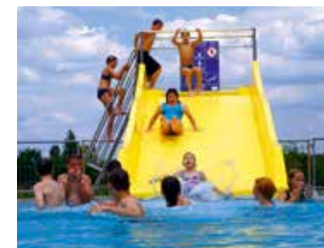
Freizeitbad Woliday Wolfen