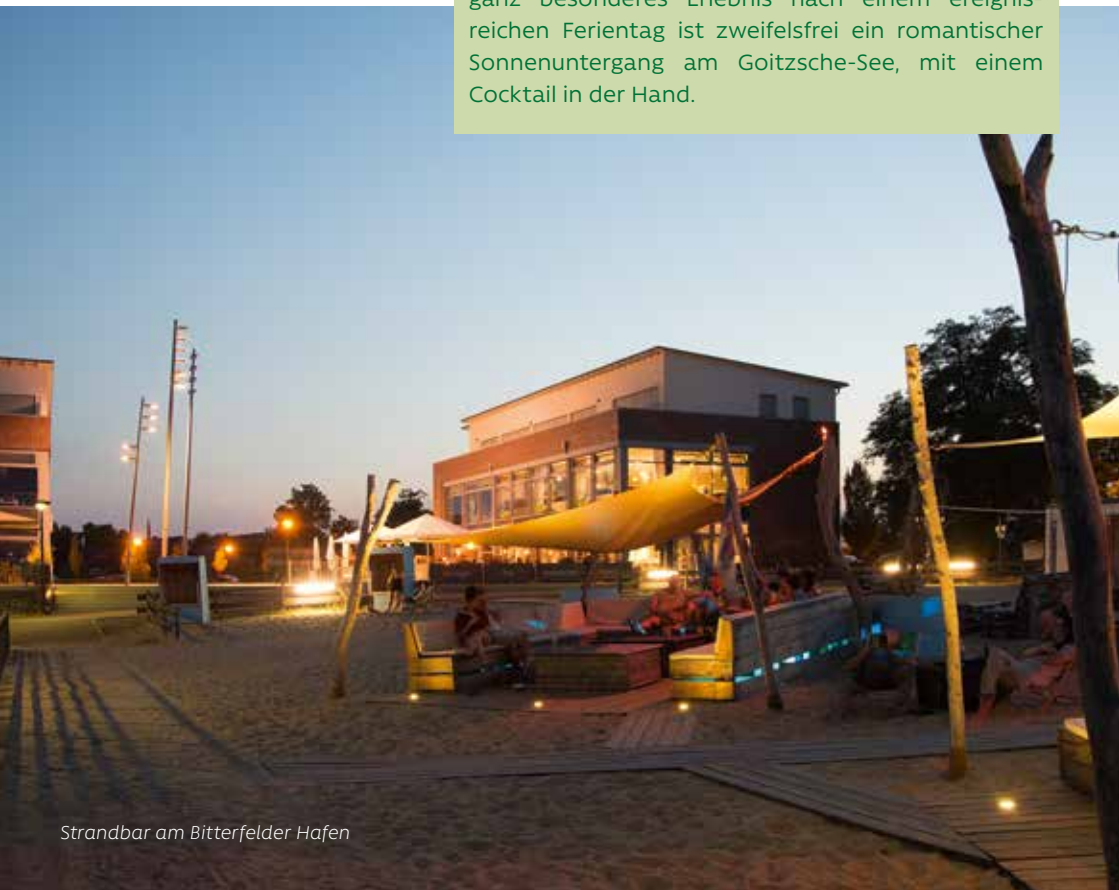
Strandbar am Bitterfelder Hafen

... so schläft man. Auch in Bitterfeld-Wolfen gibt es Übernachtungsmöglichkeiten mit dem gewissen Etwas. So ermöglicht eine Glaskuppel über dem Hochzeitszimmer der Villa am Bernsteinsee einen Blick in den (siebenten) Himmel. Die schwimmenden Ferienhäuser und Hausboote in unmittelbarer Nähe zum Campingplatz sind für die ganze Familie ein besonderes Urlaubsdomizil.