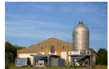
Industrie- und Filmmuseum

Der Bitterfelder Bogen hat sich zum Wahrzeichen der Stadt Bitterfeld-Wolfen entwickelt. Die auf einer ehemaligen Hochkippe stehende Stahlkonstruktion, mit 28 Meter Höhe, erinnert an eine Baggerschaufel und symbolisiert den Strukturwandel der Region. Das Kunstwerk ist nicht nur architektonisch beeindruckend, sondern bietet von seiner in 21 Meter Höhe befindlichen oberen Plattform einen sensationellen Blick über Seenlandschaft, Stadt und Umland.